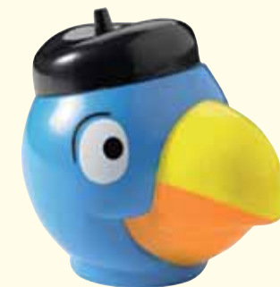
GLOBI Vanille Fr. 5.00