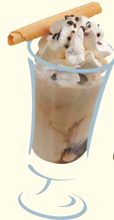
Cafe Glace So fein !! Fr. 8.50