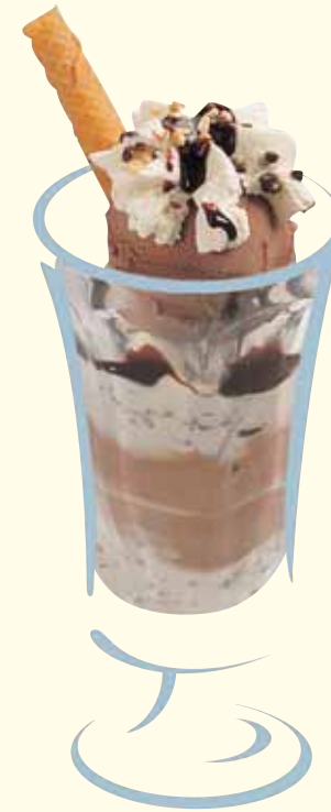
Chocobello Chocolat, Stracciatella Fr. 8.50